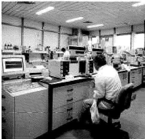
L'interno di Metapontum Agrobios